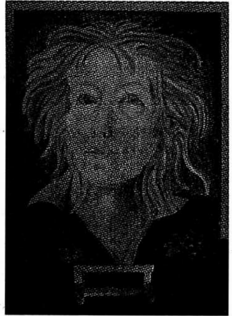
... und so sieht sie sich selbst

Die beiden Frauen planten im Rahmen des Frankenthaler Kultursommers den Termin, die Gestaltung der Einladungen, die Präsentation der Werke